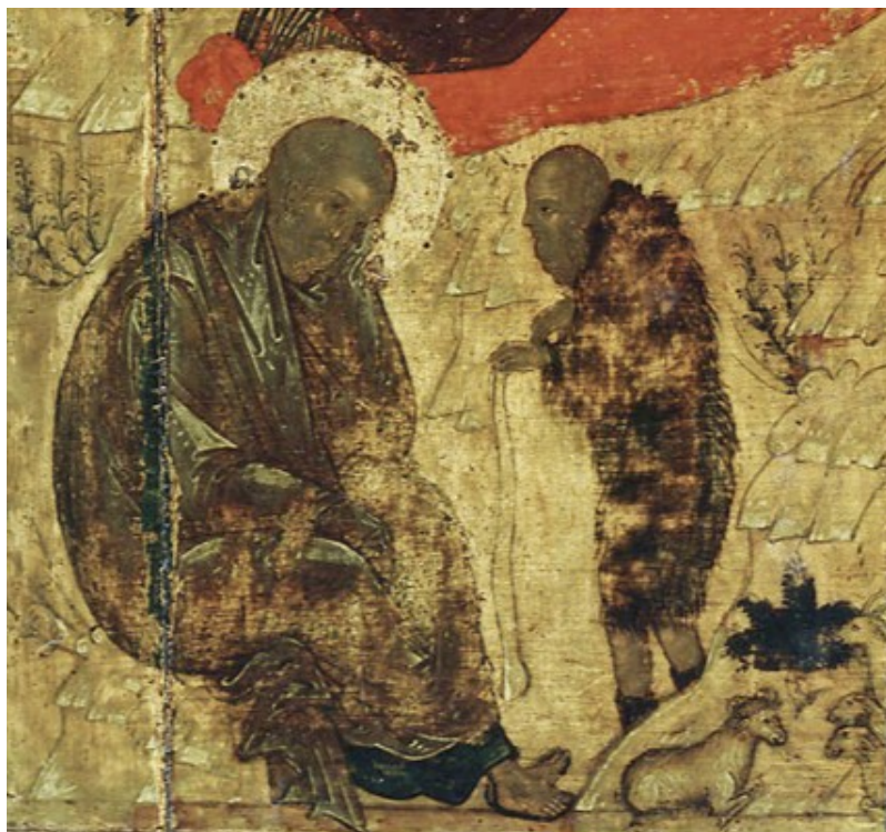
Ил. 7. Рождество Христово. Фрагмент: «Искушение праведного Иосифа» (икона Андрея Рублёва, 1405 г.)