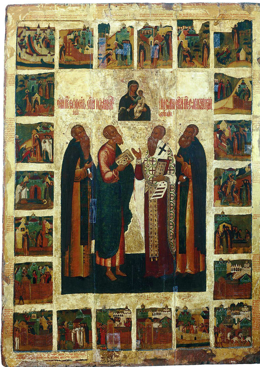
Ил. 2. Икона «Савва Крыпецкий с предстоящими и житием» (Псков, XVII век, 175x127 см.): Источник: https://clck.ru/32ZYTW

Основал его в первой половине XV столетия монах Евфросин (ил. 2). Этот удивительный факт аномалии псковского сакрально-топографического пространства смогла сохранить неизменно на протяжении пяти сотен лет только культурная память города. И чтобы понять, каким образом образовалась такая аномалия псковского сакрального пространства, да к тому же смогла сохраниться, необходимо обратиться к истории развития местной церковной структуры в ее связях с социальными институтами Пскова, а также к истории жизни самого подвижника.