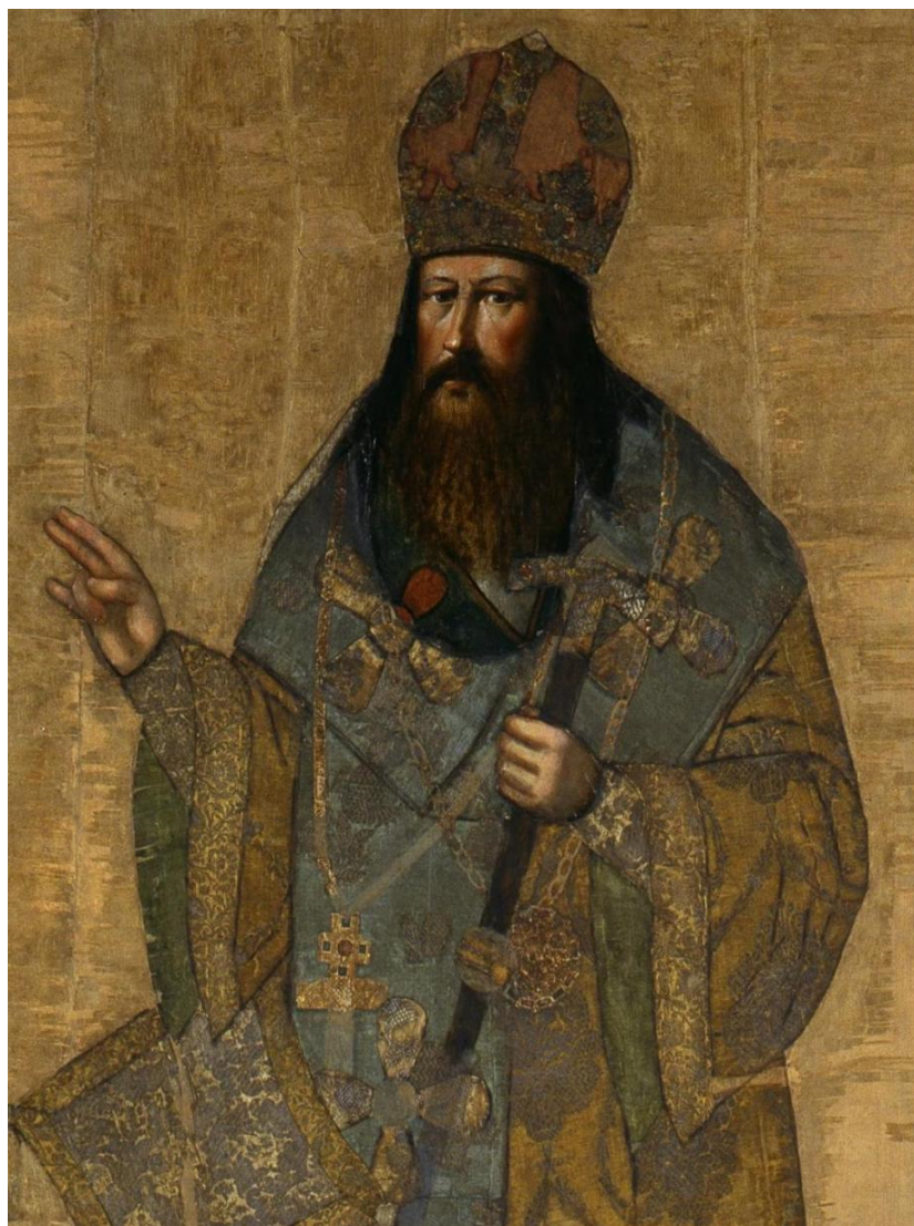
Ил. 6. Патриарх Никон (неизвестный художник, последняя четверть XVII в.): Источник: http://nav.shm.ru/exhibits/1667/

Евфросину не помог даже Большой Московский собор, который несколько откорректировал мнение Никона, указав на ошибки автора второй редакции Жития (Василия-Варлаама), а не на самого преподобного: «Не от Евфросина стало, но от списателя Евфросинова Жития, дьявольским наветом. Солгано на преподобнаго Евфросина от списателя Жития его» [Деяния 1881, 30–31]. Дальнейшая история вопроса показала, что неверное отношение к преподобному, которое было у патриарха Никона (ил. 6), всё же возобладало, несмотря на соборное определение.