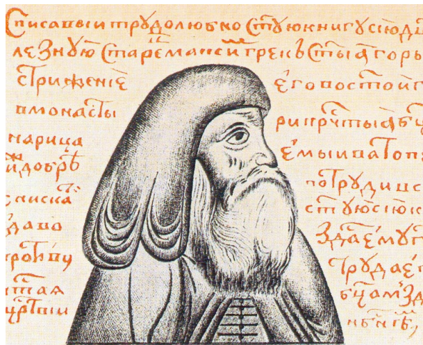
Ил. 5. Портрет Максима Грека (миниатюра из рукописного тома сочинений Максима Грека, конец XVI века)

Эта скорбь тянулась до смерти Евфросина. Всё это время он оставался для псковичей еретиком. Большинство горожан после двадцатипятилетнего бойкота Евфросину имели смутное представление о его обители и о нём самом (учитывая ранний возраст смерти в тот период и быструю смену поколений). Автору первоначальной редакции Жития Евфросина приходилось пояснять им даже название монастырского храма: «Бяше храм бысть трм святым в обители Ефросима преподобнаго» [ОР РГБ, ф. 310, № 306. Л. 108 об]. Более того, можно предположить, что Псковские соборы могли легко лишиться монашества Евфросина и даже без санкции на то правящего новгородского архиерея. Эти соборы, как правило, редко спрашивали санкции на решения внутренних вопросов псковской церковной жизни у новгородского иерарха, предпочитая всё решать самим 6 . Что ещё более оправдывает наименование монастыря и возврат к мирскому имени преподобного. Нет ни одного свидетельства ни в одном из известных источников о том, что перед смертью монах Евфросин принял схиму с прежним (мирским) именем, став вновь Елеазаром. Не было подобной практики в те времена и в рамках Студийского устава, а Иерусалимский устав только начинал овладевать умами и территориями 7 .