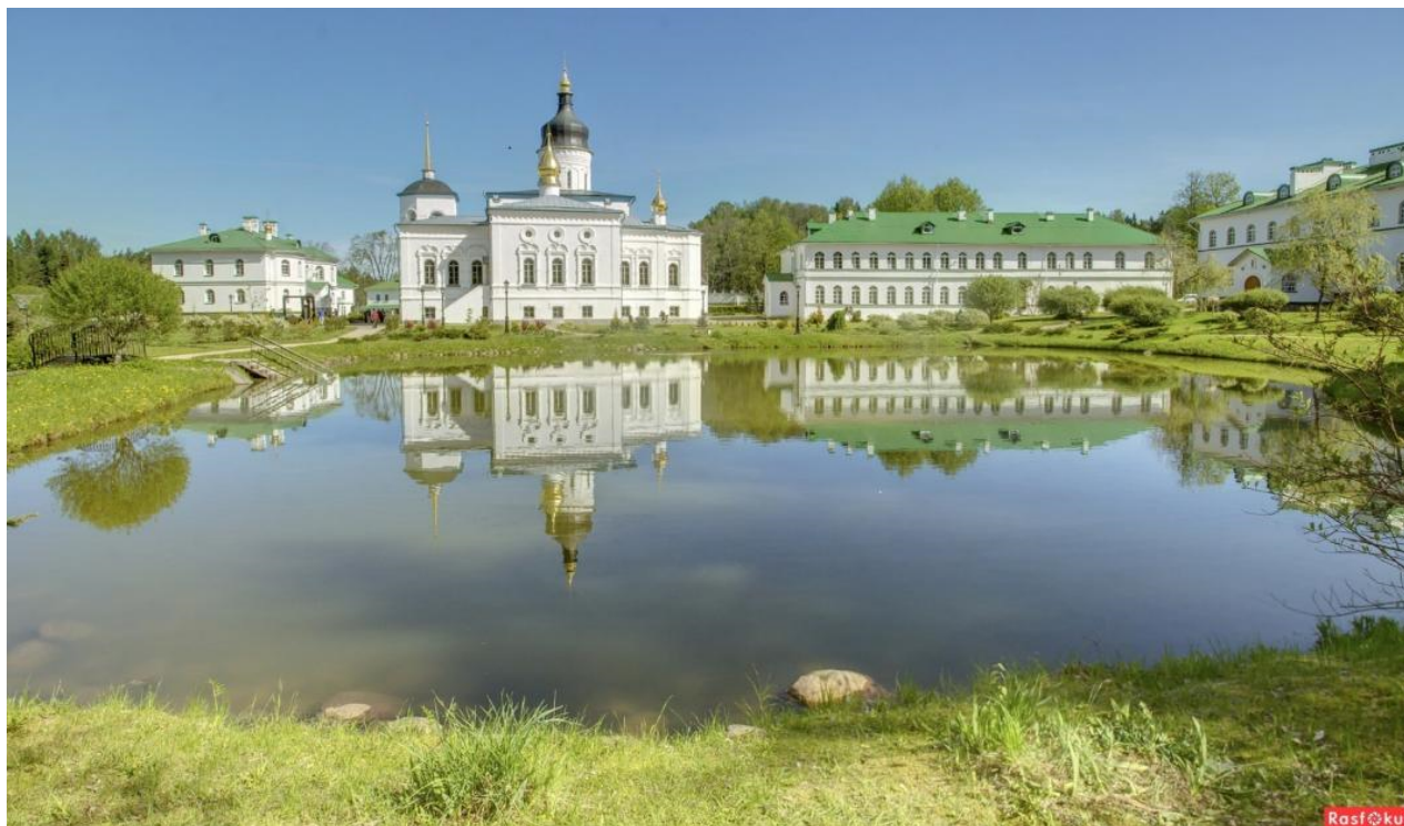
Ил. 1. Спасо-Елеазаров монастырь, современный вид

Обратимся к Псковской земле. В ее уникальной сакральной топографии наличествует, пожалуй, единственный во всём христианском мире, монастырь, названный мирским именем его основателя — Елиазаров монастырь. Это также невероятно и странно, как если бы сейчас Сергиева лавра под Москвой называлась Варфоломеевой. Елиазаров монастырь до сих пор носит это имя, правда, сегодня с приставкой «Спасо-» (ил. 1).