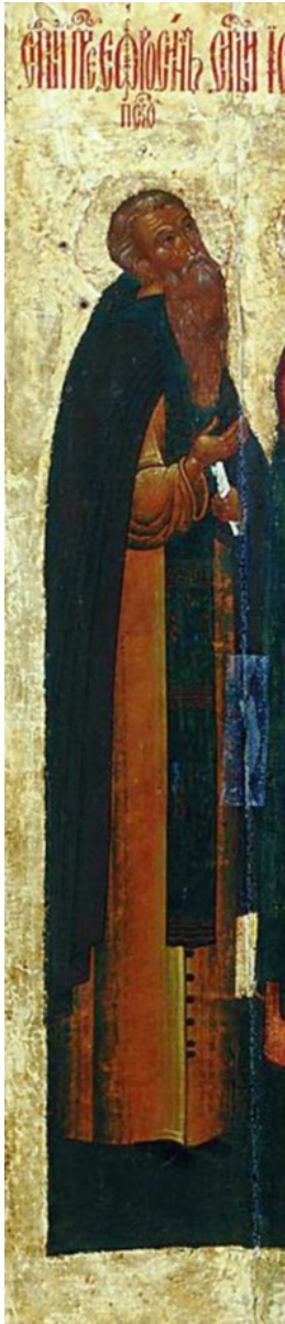
Ил. 3. «Евфросин Псковский». Фрагмент иконы «Савва Крыпецкий с предстоящими и житием»

ское пустынножителство имело влияние и за пределами Псковской земли. Таким распространителем идеалов псковского монашества был, к примеру, преподобный Нил Столобенский [Димитрий 2001, 57 об.].