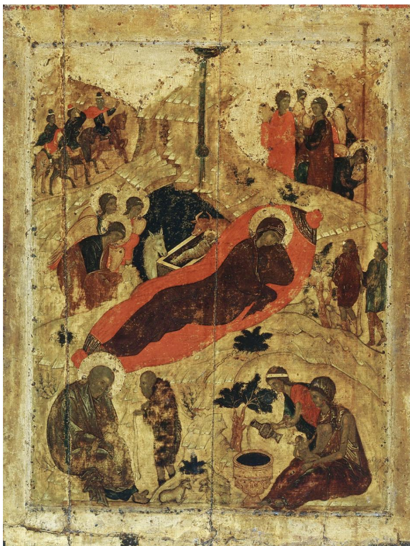
Ил. 8 Рождество Христово (икона Андрея Рублёва, 1405 г.)